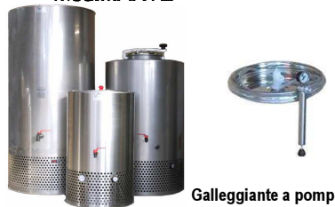
Galleggiante a pompa